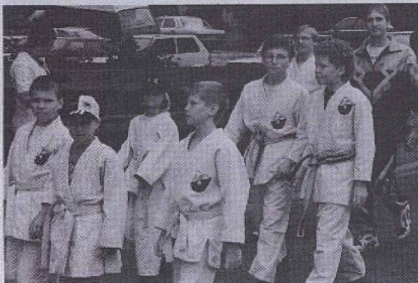
Anläßlich des 900-jährigen Jubiläums von Pödeldorf am 07.07.1996 beteiligten sich unsere Mitglieder am Festzug.

Die Mitwirkung an unserer Radtour im Mai war heuer etwas dürftig. Durch ein besonderes Auswahlverfahren, hoffen wir, künftig mehr Teilnehmer mobilisieren zu können.